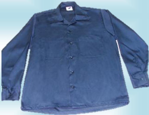
CAMISAS EN DRIL