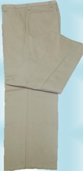
PANTALONES EN DRIL