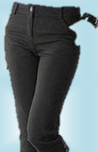
PANTALON FORMAL DAMA