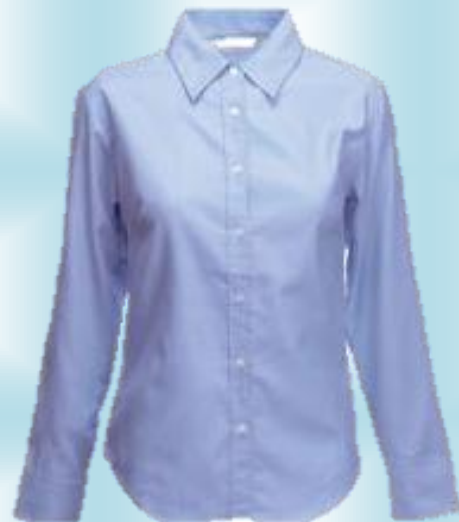
CAMISA OXFORD DAMA