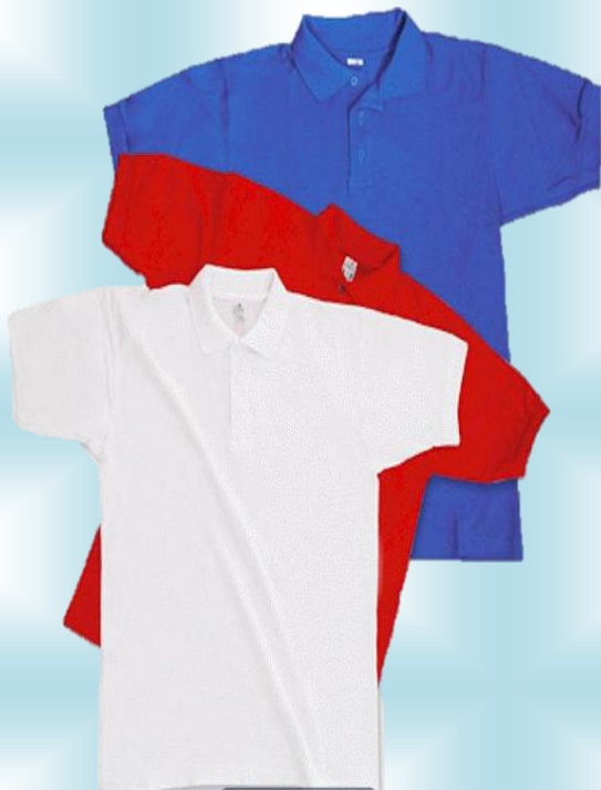
SUETER POLO DAMA-CABALLERO