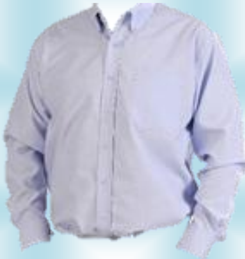
CAMISAS OXFORD CABALLERO