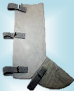
POLAINAS EN CARNAZA