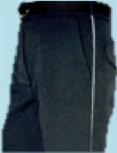
PANTALONES LINO FLEX