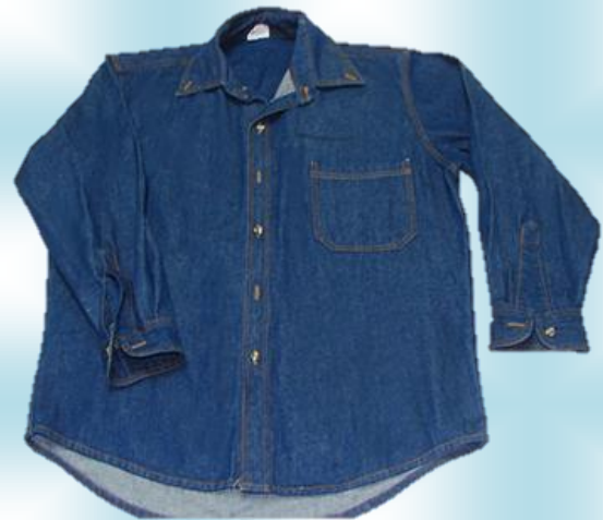
CAMISAS Y CHAQUETA EN JEANS